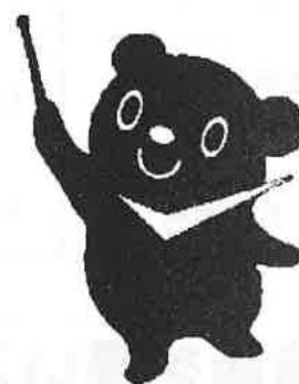
最低賃金制度のマスコット チェックマン