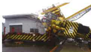
平成30年9月台風21号での大阪港の被害状況

風水害による被害は年々上昇傾向に! 毎年、各地で発生する災害だといえることから事業継続としての備えが必要!