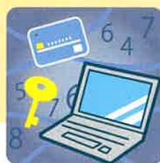
情報セキュリティ事故