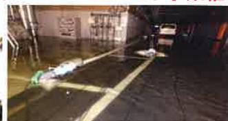
近畿南部で48時間雨量350mm(50年に一度の規模)関西国際空港(第1ターミナル)において最大浸水90cm

YoutubeでBCP解説動画を配信中!! 「事業継続の取り組み〜脅威に負けない組織作り〜」