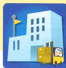
サプライチェーンの途絶