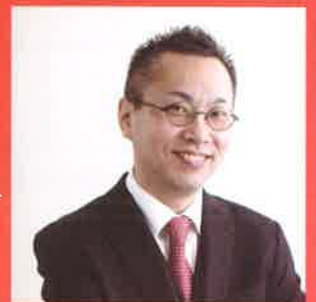
株式会社ネクストフェイズ 代表取締役

1964年大阪生まれ。関西大学卒業後、地元地域金融機関に勤務。 2000年12月に勤務先が破綻したことにより 「カネなし」「資格なし」「人脈なし」「経験なし」の状況にもかかわらず 経営コンサルタントとして独立。 その後営業努力を重ね、現在は年間200回以上のセミナー・講演を行う傍ら、30件以上の顧問先に対してコンサルティングを行っている。 主な著書に「銀行融資を3倍引き出す！小さな会社のアピール力」（同文館出版）など。