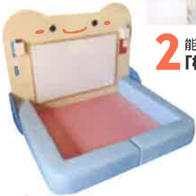
3 小さな店舗等、小スペースでも設置できるキッズコーナー「バタ☆ボン」