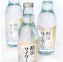
2 能勢の地サイダー「桜川サイダー」