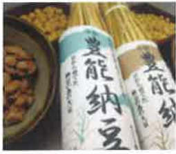
1 地元豊能町で栽培した大豆から作った「豊能納豆」