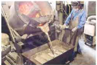
5 歩留まり向上と「3R」を実現する「小型アルミ灰絞り装置」