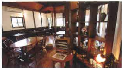
4 能勢の大正時代の古民家を改装したカフェ&レストラン「Dear N's Kitchen」