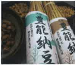
1 地元豊能町で栽培した大豆から作った「豊能納豆」