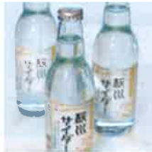
2 能勢の地サイダー「桜川サイダー」