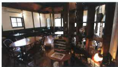
4 能勢の大正時代の古民家を改装したカフェ&レストラン「Dear N's Kitchen」