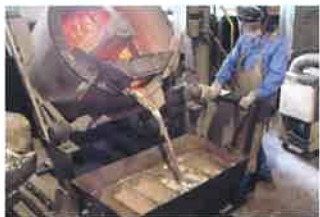
5 歩留まり向上と「3R」を実現する「小型アルミ灰紋り装置」