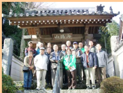
観光ボランティアガイドの会(朝川寺) (今回、私たちがご案内致します。)

春の息吹を感じながら…豊能路をぶらり散策。ええもんあるで!…途中、元気な「地域産業見学」や「坐禅体験」も…楽しいかも。大阪の穴場探しに出かけませんか!!